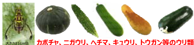
カボチャ、ニガウリ、ヘチマ、キュウリ、トウガン等のウリ類

セグロウリミバエ の被害を防ぐため、 家庭菜園・畑 における ウリ類 への 消毒 ・ 不要果の片付け をお願いします。