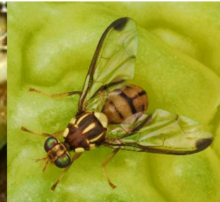
成虫は8〜9mm 実際の大きさ→