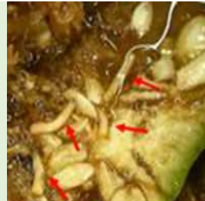
幼虫によるヘチマの食害